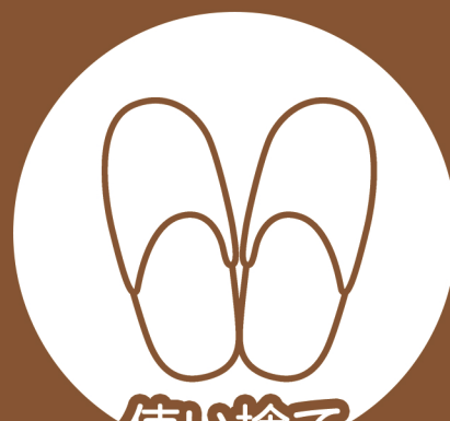
使い捨て スリッパの提供