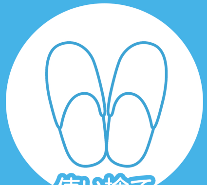
使い捨て スリッパの提供