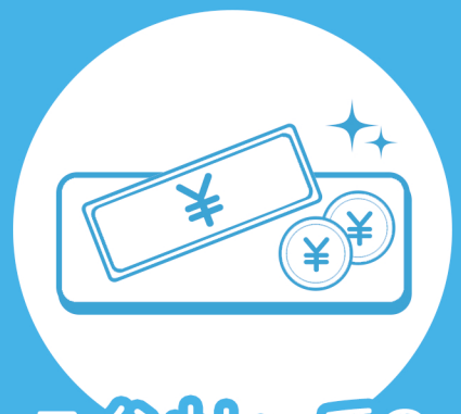
コイントレイでの 受け渡し